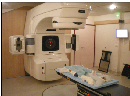
Photographie d'une salle de traitement de radiothérapie